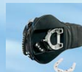
Tankrucksack, klein, mit Ringbefestigung