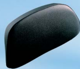
Rückenpolster für Top Case