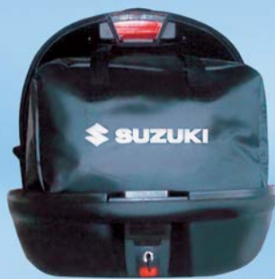
Innentasche für Top Case

Wasserabweisendes Material Best.-Nr. 997SO-INNER-BAG