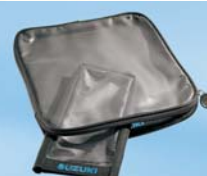
Kartenfach für Tankrucksack klein