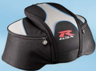
Hecktasche 28 Liter