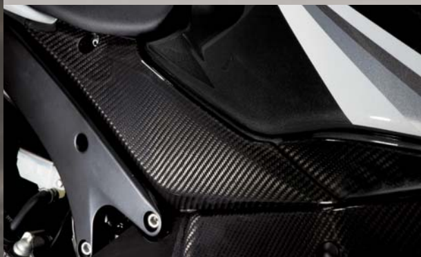
Untere Sitzbankabdeckungen, Set