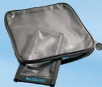
Kartenfach für Tankrucksack klein